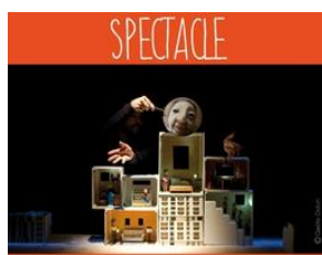
ON VIVRAIT TOUS ENSEMBLE (MAIS SEPARÉMENT)

En première partie, les Eclaireurs en textes » mettront en voix « Désordre de Violoncelle », un texte de Géhanne Khalfallah, auteure algérienne.