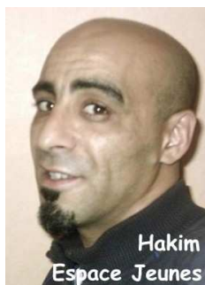
Hakim Espace Jeunes

Sauf indication contraire, les animations se déroulent de 14 H 00 à 19 H 00.