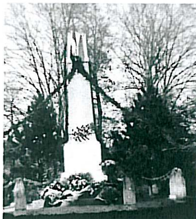
Le monument aux morts, le 11 novembre 1948

Elle se poursuivra à la salle des fêtes autour du verre de l'amitié ; toute la population est conviée à s'associer cette commémoration.