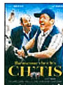
Lundi 14 juillet Bienvenue chez les Ch'tis