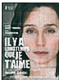
Lundi 2 juin Il y a longtemps que je t'aime