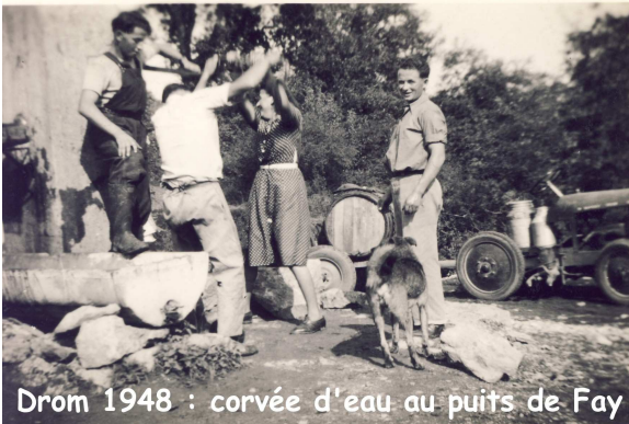
Drom 1948 : corvée d'eau au puits de Fay

Un demi-siècle plus tard, en 1906, lors d'une période de forte sécheresse, on se souvint de cette cavité et on recreusa un puits, aménagé avec une pompe manuelle et un bac en pierre. Après la dernière guerre Il lui fut ajouté un moteur et une cuve qui servirent jusqu'à l'adduction du village au réseau d'eau.