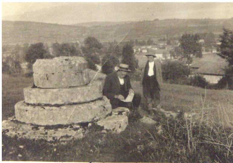
1927. Croix de pierre.

Cet édifice était un monument funèbre qui daterait du VI ème ou VII ème siècle, destiné à l'inhumation des enfants mort-nés sans baptême (qui étaient « nuitamment portés au calvaire » dans une cavité sous le socle). Chaque année, lors de la fête de l'Ascension, la foule se rendait en procession sur ce lieu. Cette pratique aurait cessé en 1793 ; époque à laquelle a été démolie la croix, sur laquelle était taillée un Christ en relief. Déplacé de 5 mètres vers l'est en 2006, le socle a retrouvé une « nouvelle » croix.